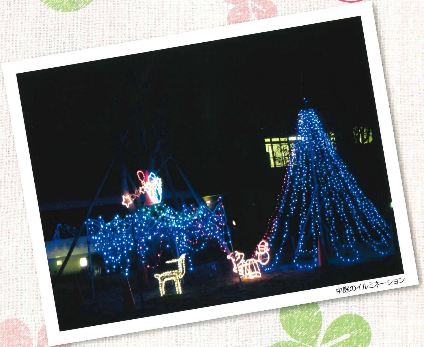
中庭のイルミネーション